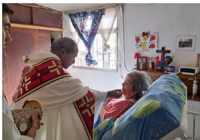
El Padre Arull Dhas visitó a los enfermos de la comunidad parroquial.