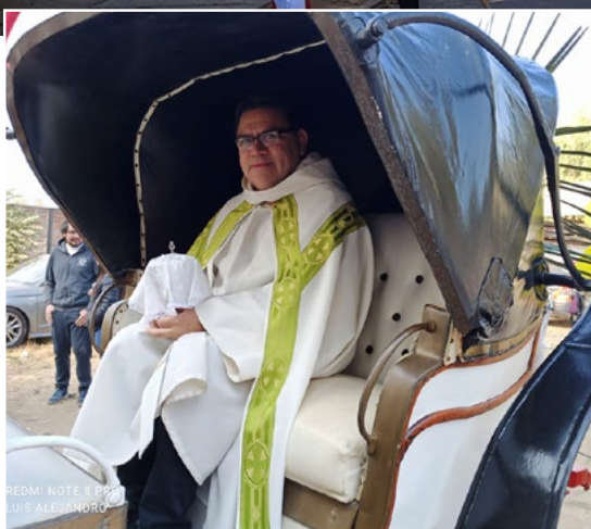
La parroquia Santa Ana de Rengo también celebró Cuasimodo, llevando la comunión a los enfermos.