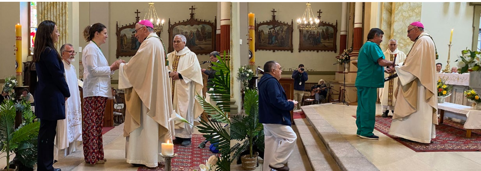
Representantes de los gremios participaron en la misa.