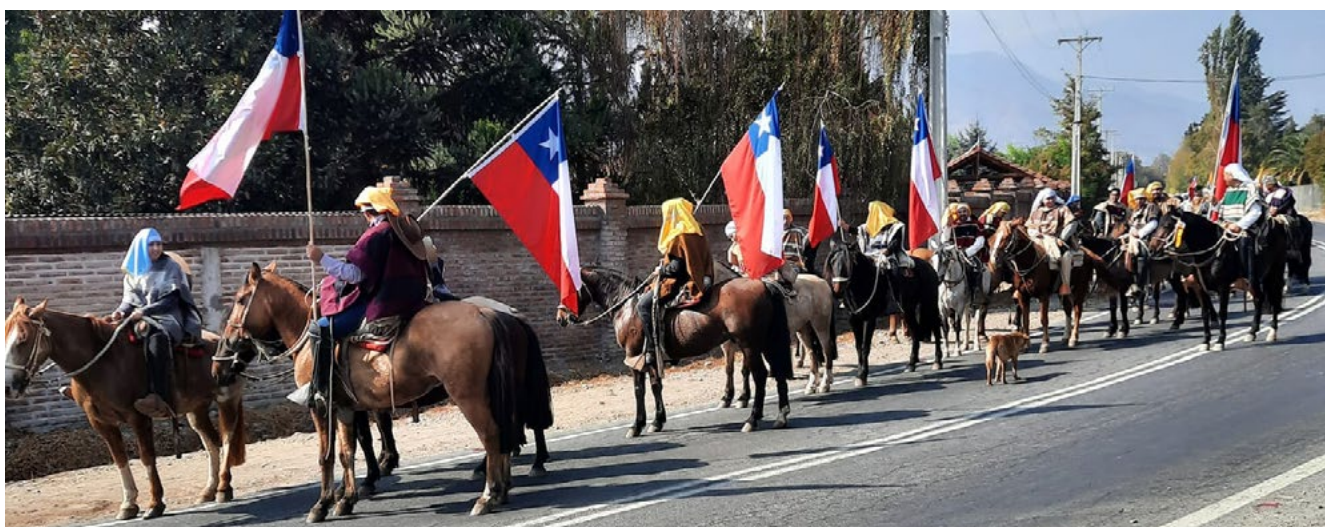
Los huasos recorrieron las calles, resguardando al sacerdote para que visitara los hogares y especialmente a los enfermos. En la fotografía, en el sector de Lo de Lobos de Rengo.