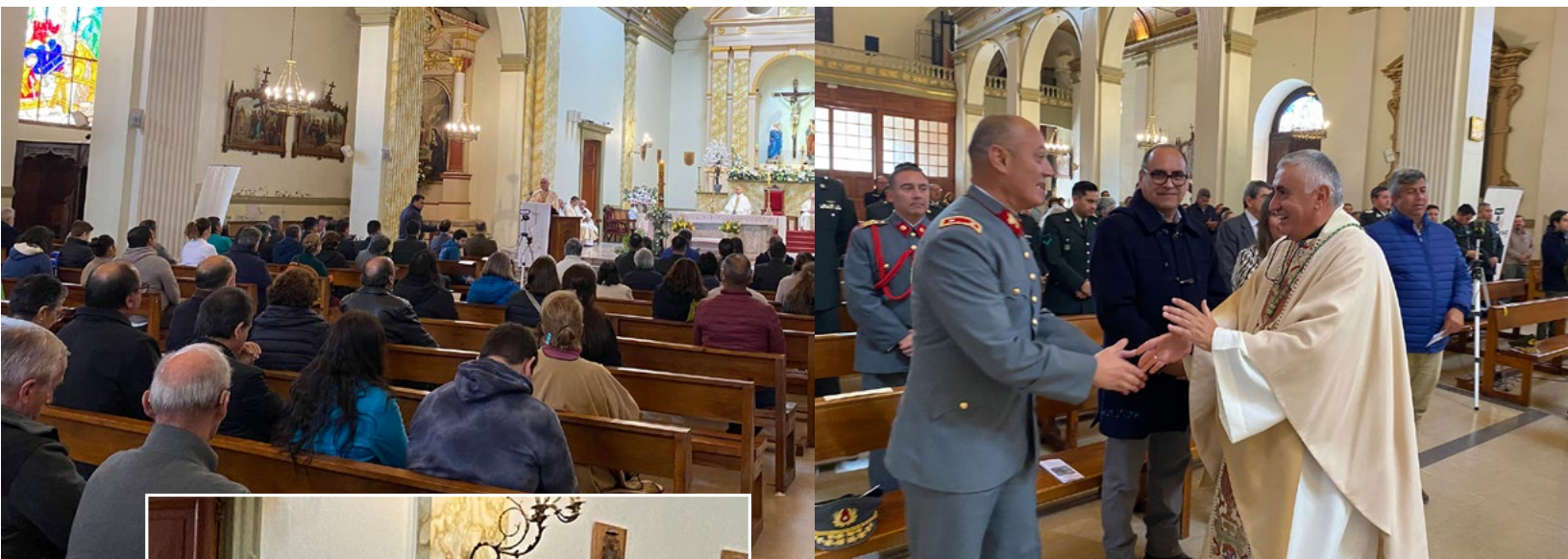
Autoridades regionales y locales asistieron a la Eucaristía por el Día del Trabajo.