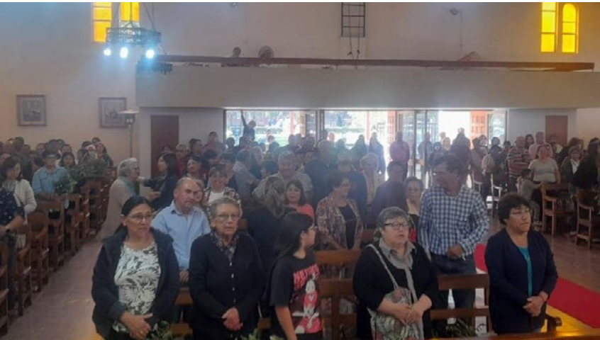
Los fieles de Chimbarongo participan con mucha fe y devoción en las diferentes acciones pastorales de la iglesia.