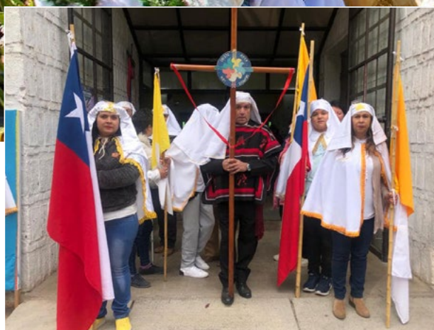
En la parroquia San Juan Bautista de Machalí los cuasimodistas recorrieron las calles.