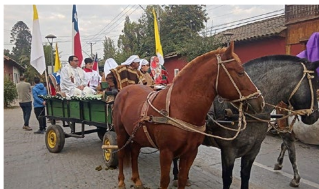
En la parroquia Asunción de María, de Quinta de Tilcoco, el sacerdote recorrió las calles en carreta, escoltado por los huasos a caballo.