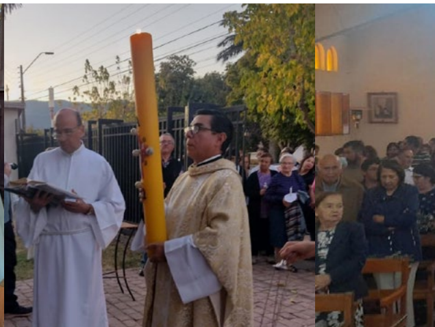
Semana Santa en la parroquia Nuestra Señora de La Merced de Chimbarongo.