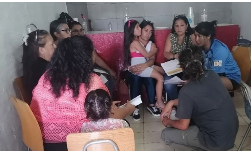
En Caritas Rancagua explican que ha sido muy importante la capacitación de quienes ejecutan la olla común para mejorar su gestión.