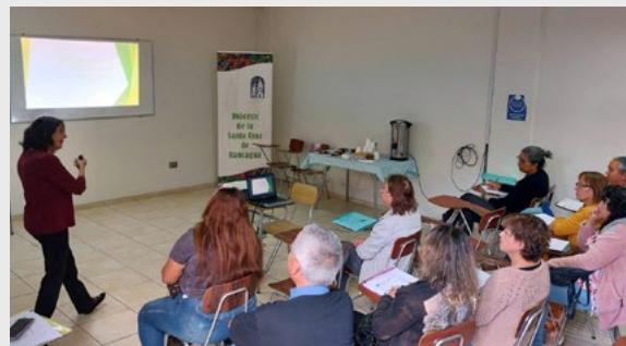
Cerca de 30 personas están participando en este curso de capacitación que comenzó el 20 de abril.

Quienes estén interesados en participar deben ser mayores de 18 años, haber cursado enseñanza básica completa y deben comunicarse al +56963717643 o escribir al mail: cap.cuidadosadultosmayores@gmail.com