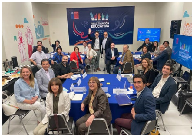
Miembros del Consejo Asesor Presidencial para la reactivación educativa.

sus familias, los educadores y los directivos han experimentado altos niveles de estrés en estos años, lo que se ha visto reflejado en deserción y ausentismo escolar y licencias médicas de los y las docentes. Se estima que más de 50.000 estudiantes, no volvieron a clases después de la pandemia, lo que implica un 12,9% menos respecto del año 2019. Con relación a la inasistencia grave, el índice aumenta en un 10% en el mismo periodo.