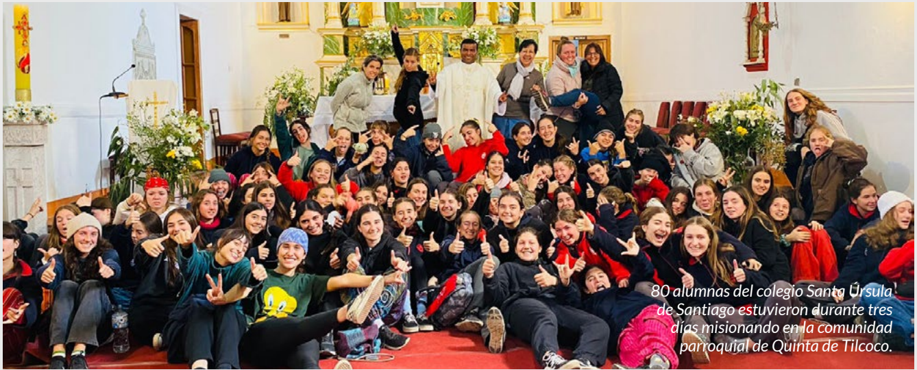
80 alumnas del colegio Santa Úrsula de Santiago estuvieron durante tres días misionando en la comunidad parroquial de Quinta de Tilcoco.