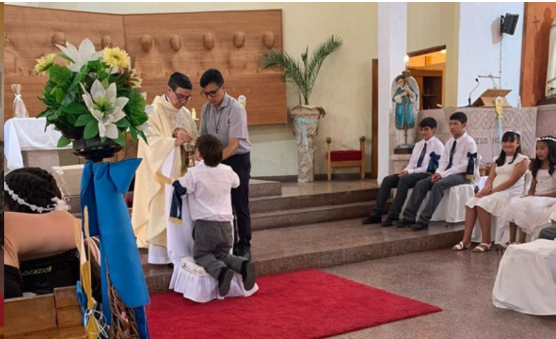
Después de la pandemia, los niños y niñas han podido recibir el sacramento de la Primera Comunión. Este año la catequesis regresó con normalidad.

ese sentido, enfatizó que sí surge la idea de crear otras pastorales, éstas son bienvenidas.