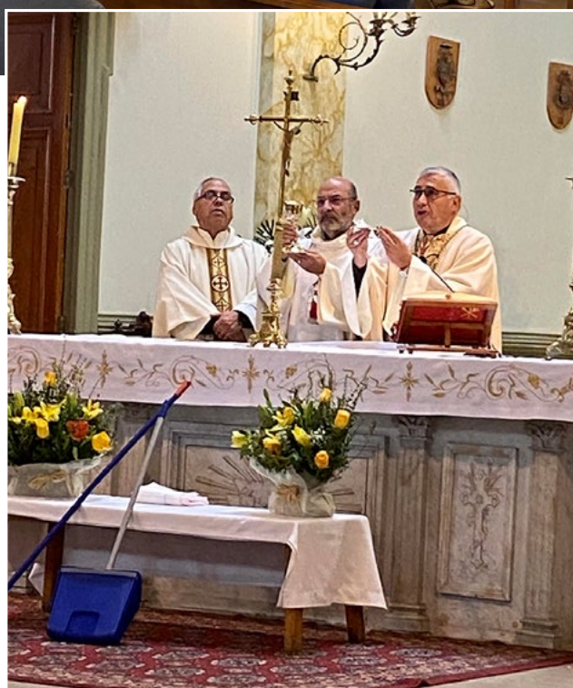
El obispo de Rancagua destacó la dimensión del trabajo, al celebrar el 28 de abril, una Eucaristía por el Día del Trabajo.

santificar el propio trabajo (es decir: hacerlo bien, bajo la mirada de Dios, ofreciendo su trabajo a Dios, haciéndolo con alegría y fortaleza). Los hombres y las mujeres que, mientras procuran el sustento para sí y su familia, realizan su trabajo de forma que resulte provechoso y en servicio de la sociedad, con razón pueden pensar que con su trabajo desarrollan la obra del Creador, sirven al bien de sus hermanos y contribuyen de modo personal a que se cumplan los designios de Dios en la historia”.