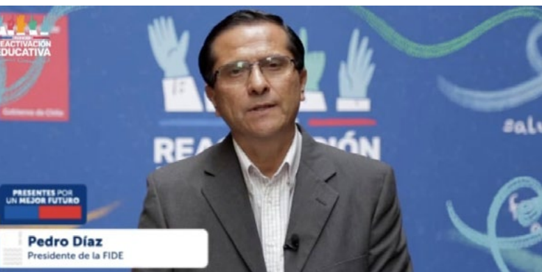
Pedro Díaz Cuevas, presidente nacional de FIDE.

Para estos efectos, se convocó a un grupo de más de 20 personas representativas de diferentes ámbitos y sensibilidades del país: líderes educativos Cabe destacar el significativo nivel de transversalidad de dicho Consejo. FIDE, fue convocada como un actor histórico y principal gremio de la educación particular, además, hasta ahora representantes de la educación católica.