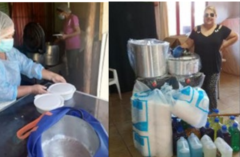
Este último convenio ha significado que se hayan beneficiado 43 ollas comunes.